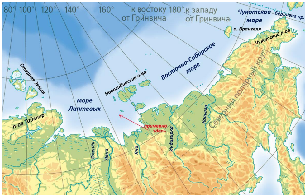
Среди Новосибирских островов - совсем маленький о. Яя

Да, Россия стала ещё немного больше. В 2013 году был найден, а потом нанесён на официальную карту новый остров под названием Яя. Небольшая часть суши была обнаружена вертолётчиками в море Лаптевых, затем экипаж исследовательского судна «Адмирал Владимирский» высадился на острове и установил там российский флаг.